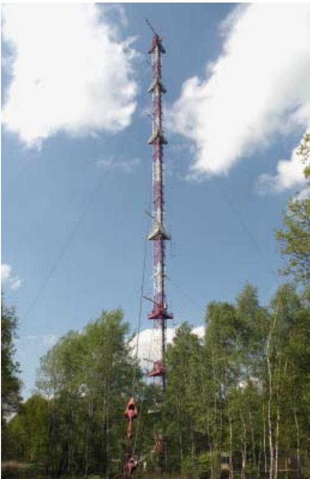
Der Umgebungsüberwachung des Forschungszentrums dient auch der meteorologische Turm, mit 124 Metern das höchste Bauwerk.

Messgeräte innerhalb und außerhalb des Forschungszentrums Jülich überwachen ständig Atmosphäre, Böden und Gewässer. Ein Teil der Messdaten wird direkt – ohne dass das Forschungszentrum Einfluss darauf nehmen kann – an die Aufsichtsbehörde weitergeleitet. In der jahrelangen Überwachungspraxis ist es dabei nie zu Beanstandungen gekommen.