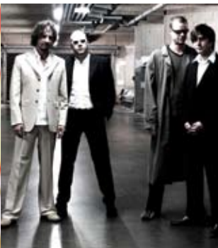
The Mighty Sleepwalkers